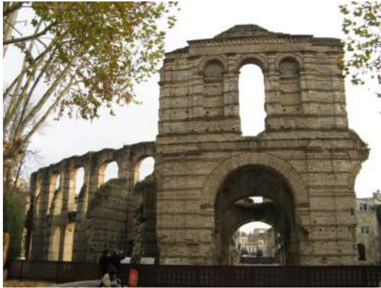
Ausone, Ordo urbium nobilium , XIV :

Burdigala est natale solum, clementia caeli mitis ubi et riguae larga indulgentia terrae, uer longum brumaeque nouo cum sole tepentes aestifluque amnes, quorum iuga uitea subter feruent aequoreos imitata fluenta meatus. Quadrua murorum species, sic turribus altis ardua, ut aérias intrent fastigia nubes. Distinctas in terna uias mirere, domorum dispositum et latas nomen seruare plateas, tum respondentes directa in compita portas per mediumque urbis fontani fluminis alueum, quem pater Oceanus refluo cum impleuerit aestu, adlabi totum spectabis classibus aequor.