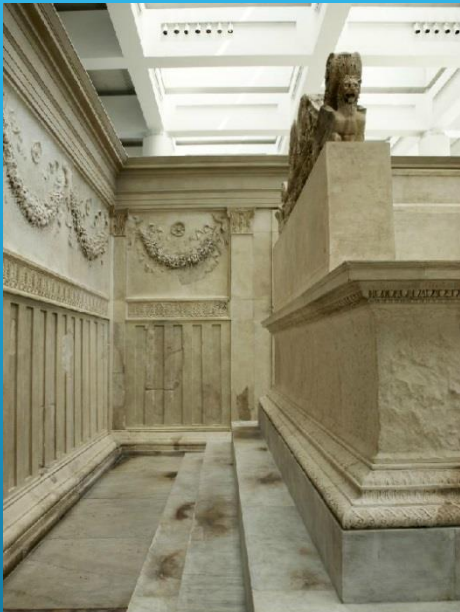
Intérieur de l'autel.

Dans la partie basse, le décor imite, en marbre, une palissade de bois, semblable à celles qui entouraient les sanctuaires rustiques - c'est-à-dire les sanctuaires primitifs situés à la campagne. Cela correspond bien au rappel de l'âge d'or, cette période parfaite et idéale pendant laquelle les hommes vivaient en harmonie avec les dieux et la Nature.