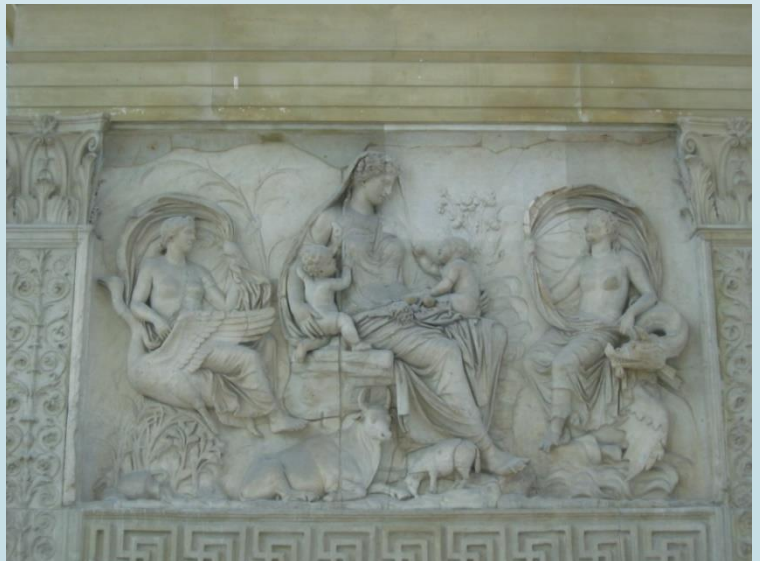
Panneau de Tellus.

L'autel s'élève à l'intérieur d'une grande enceinte à laquelle on accède par trois marches. Le mur extérieur est décoré de bas-reliefs sur les faces avant et arrière. Une frise à feuilles d'acanthe orne le registre inférieur de la face externe. En haut, des bas-reliefs figuratifs représentent des scènes allégoriques et mythologiques ; sur le côté Est sont figurés la grotte du Lupercal (où, selon la légende, Romulus et Rémus auraient été allaités par la louve) puis Enée pratiquant une offrande aux Pénates. Sur les côtés latéraux se déroule la procession votive de l'inauguration, avec notamment la présence de la famille d'Auguste : derrière un groupe de flamines, on trouve Agrippa et Julia, fille d'Auguste, en compagnie du petit Caius César et du futur empereur Tibère.