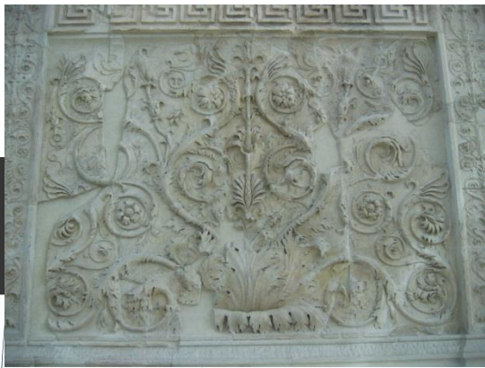
Feuilles d'acanthé en rinceaux.