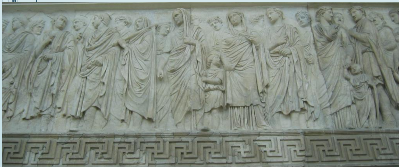
Procession de la famille impériale (frise ouest).

C'est le dieu soleil Apollon qui légitime la paix d'Auguste en venant poser ses rayons dans le monument exaltant la dynastie augustéenne et le régime. Apollon en personne focalise l'ensemble du prestige augustéen car c'est lui qui justifie l'Age d'Or de la Pax Augusta . Le dieu solaire idéalise de sa propre aura le prestige d'Auguste car c'est Apollon en personne qui cautionne l'âge d'or retrouvé. On sait d'ailleurs que le culte du dieu soleil connaît un regain de ferveur sous Auguste : lui-même va lui dédier un temple sur le Palatin, près de sa maison, à la suite d'un présage divin.