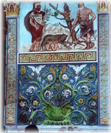
Restitution de la polychromie.