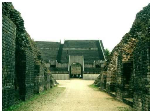
Amphithéâtre de Grand