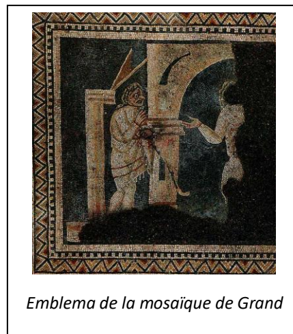
Emblema de la mosaïque de Grand