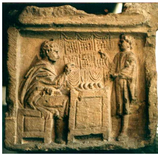
Étalage d'un orfèvre Musées de la cour d'or, Metz