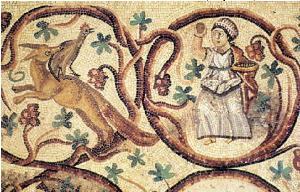
Détail d'un décor de sol, VI e siècle après J.C. ; Kabr Iram (Phénicie romaine), conservé au Louvre

1. Comment appelle-t-on ce type de pavement ? Justifiez votre réponse. / 2