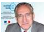
Gérald CHAIX Recteur de l'académie de Nantes □ Chancelier des universités

Qu'il s'agisse de l'inscription delphique " Connais-toi toi-même ", fondement de la sagesse socratique qui est refus de la démesure et quête de l'accomplissement humain ; qu'il s'agisse de cette "voie romaine", spécifique sans doute à l'Europe, qui est goût pour l'altérité et, sur la base de ce rapport à l'autre (qui n'a pas échappé historiquement à la violence !), capacité à faire un retour critique sur soi-même ; qu'il s'agisse, parmi beaucoup d'autres, de la relecture qu'en donne Erasme, au seuil de la modernité, et qui est la justification même de toute éducation : " on ne naît pas homme, on le devient : homines non nascuntur, sed effinguntur ". □ □ □